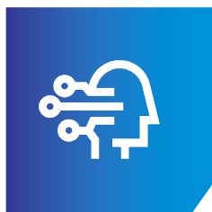
Digital Industry & Technology