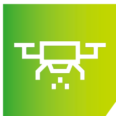
Smart Food Production