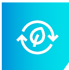
Prevention & MedTech